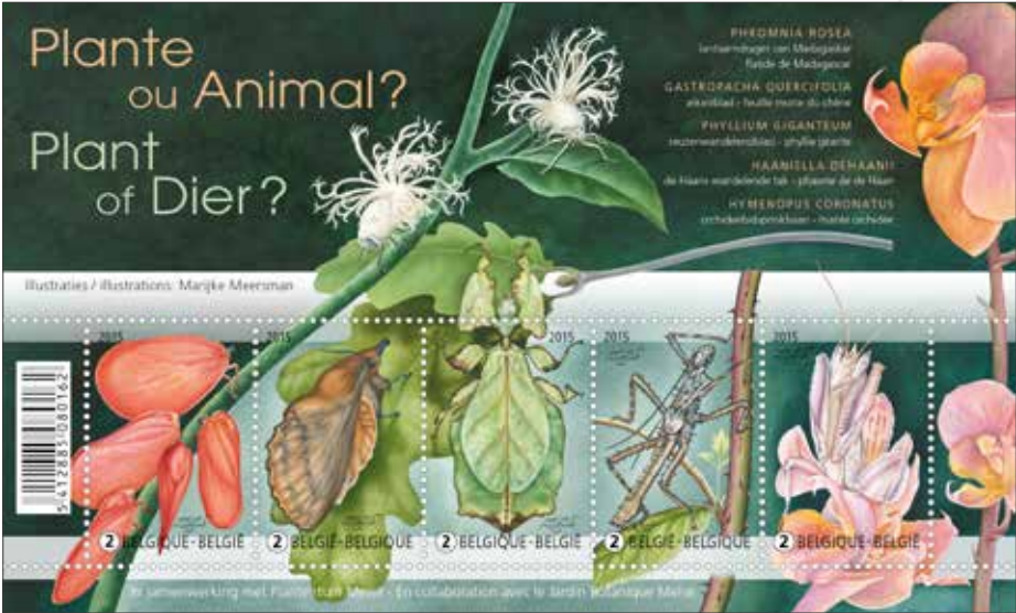
CODE : 28067

Faisons le test : distinguez-vous ces cinq champions du camouflage ? La Phromnia rosea ou porte-lanterne de Madagascar se dissimule entre les lupins d'un rose tout aussi éclatant que le sien. Sur un arrière-plan de feuilles de chêne colorées, le papillon de nuit Gastropacha quercifolia (feuille morte du chêne) est à peine visible. La Phyllium giganteum ou phyllie géante met encore la barre plus haut et excelle véritablement dans l'art du mimétisme. L'insecte ne se contente pas d'imiter la couleur de l'environnement, mais il va même jusqu'à en reproduire les nervures. Durant sa jeunesse, qui n'a jamais eu de phyllie géante comme « animal de compagnie » ? Peut-être que ce phasme ou Haaniella dehaanii en faisait partie ... Sur le timbre-poste, celui-ci est bien caché entre les épines de son hôte végétal. Vous êtes persuadé de voir une splendide orchidée sur le cinquième timbre-poste ... C'est en partie le cas, mais c'était sans compter sur la présence d'une Hymenopus coronatus , plus communément appelée mante orchidée !