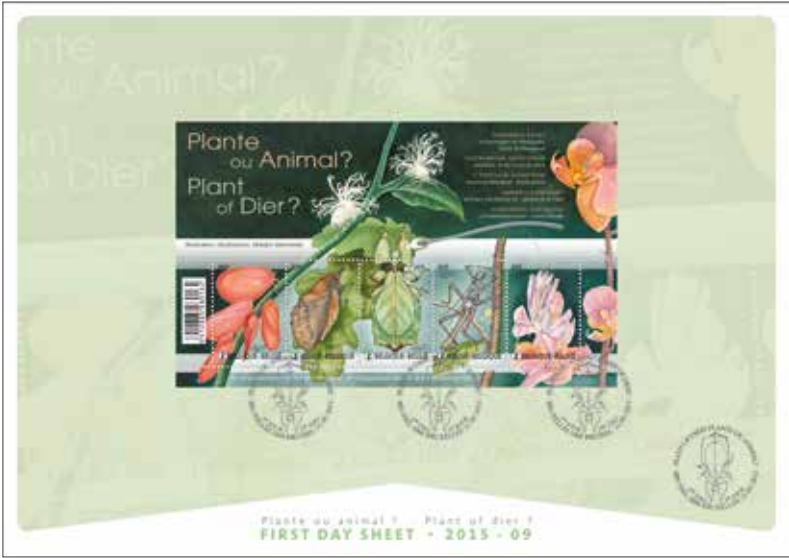
CODE : 28113