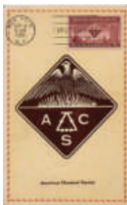
twee "eerstedag" afstempelingen