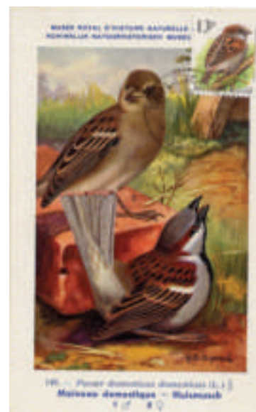
réalisation personnelle carte du musée