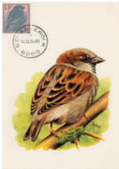
carte réalisée à partir d'une carte Buzin et d'un timbre découpé d'un entier postal

Les "directives pour l'utilisation des règlements permettant d'évaluer les présentations thématiques" émanant de la Fédération Internationale de Philatélie (F.I.P.) précisent dans l'article 3.2.3. (Le matériel philatélique).✂